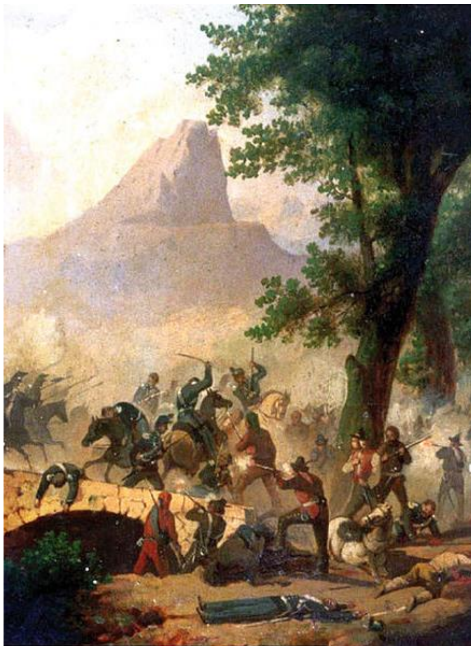
Figura 1. Scene di brigantaggio preunitario. 10

Tornando al Decennio francese, è innegabile che il fenomeno del brigantaggio conobbe una crescita nel periodo dell'occupazione militare francese, così come era accaduto nei vari cambi di regime 8 . Oltre ai problemi legati all'occupazione militare, anche per una serie di altri motivi connessi alla crisi agricola degli anni 1801-1803, alla insufficiente forza di pubblica sicurezza, alle rivendicazioni di tipo economiche e di sussistenza, alla mancanza di conoscenza del territorio da parte di questi ultimi. In questo periodo vi fu un moltiplicarsi di bande che terrorizzavano interi paesi e tenevano in allerta continua il neo governo 9 .